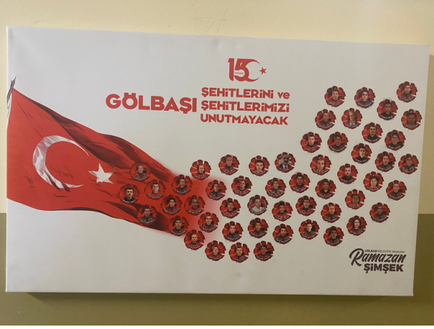
15 Temmuz gecesi Gölbaşı Özel Harekat Başkanlığında 43 özel harekat polisi şehit oldu...

Soru:4 Yaşanan olayı duyunca neler hissettiniz ?